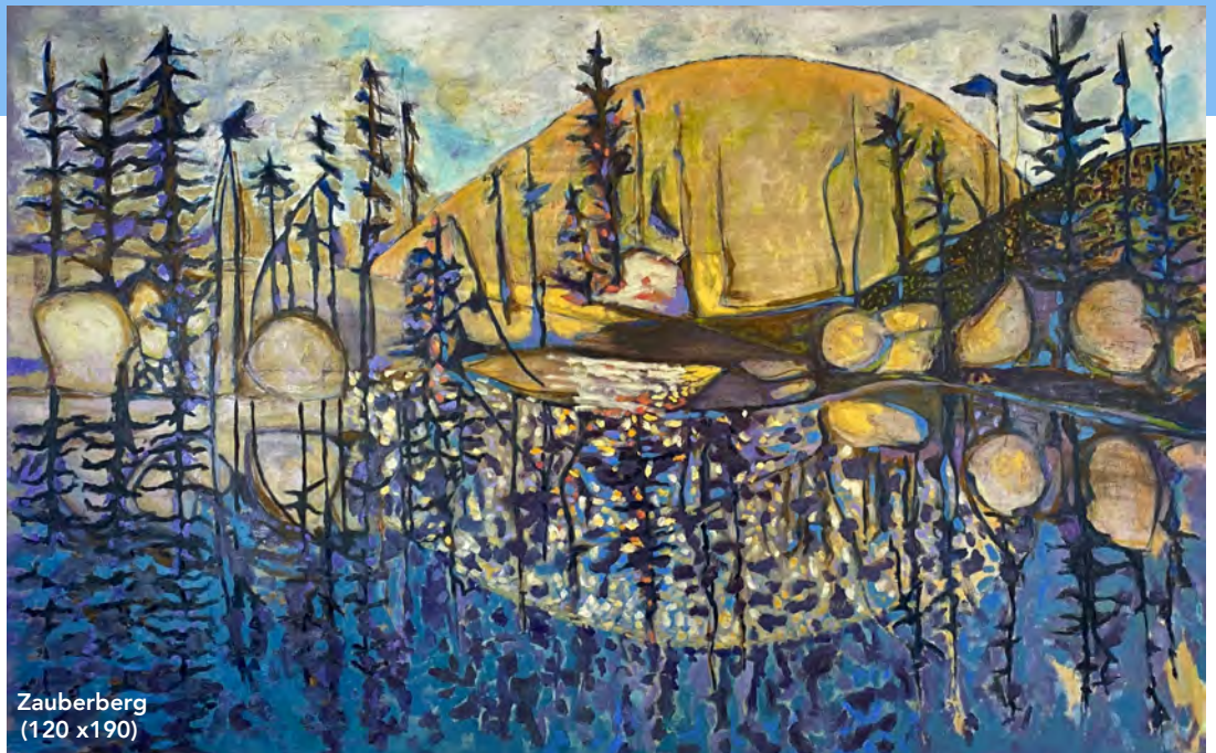
Zauberberg (120 x 190)