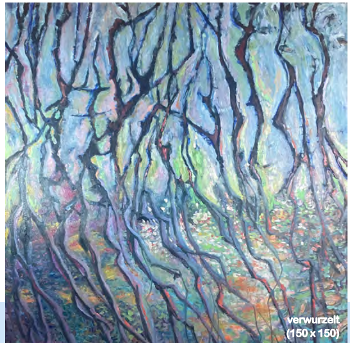
verwurzelt (150 x 150)

Conny Pfisters Ölbilder repräsentieren eine aktuelle Facette ihrer langen und intensiven, künstlerischen Auseinandersetzung mit Farben und Formen: Nach ihrer Ausbildung an der Kunstgewerbe-Schule Zürich gründete sie ihre eigene Firma "Contra-Punkt" mit dem Fokus auf keramischen Produkten, Leinen und Wohnaccessoires und entwickelte parallel dazu ihre eigene Ölmalerei: Die vornehmlich grossformatigen, halb-abstrakten Bilder präsentierte sie regelmässig in eigenen Ausstellungen, u.a. in der firmeneigenen Contra-Punkt Galerie im Zürcher Niederdorf. Momentan wohnt und arbeitet sie in St. Gallen und in ihrem Atelier im Berner Oberland.